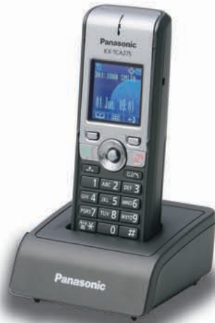
KX-TCA275 Modelo compacto Negocio