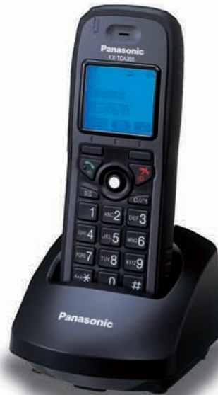
KX-TCA355 Modelo Resistente