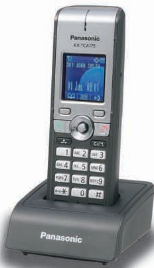
KX-TCA175 Modelo Estándar